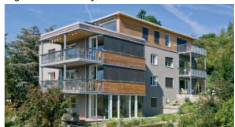
Segantinistrasse - efter