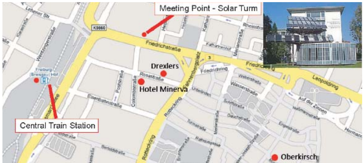
Kort over: station - hotel - Solar Turm - restauranter

19:00 MIDDAG Restaurant Drexler ligger i samme gade som hotellet, på modsatte side af vejen.