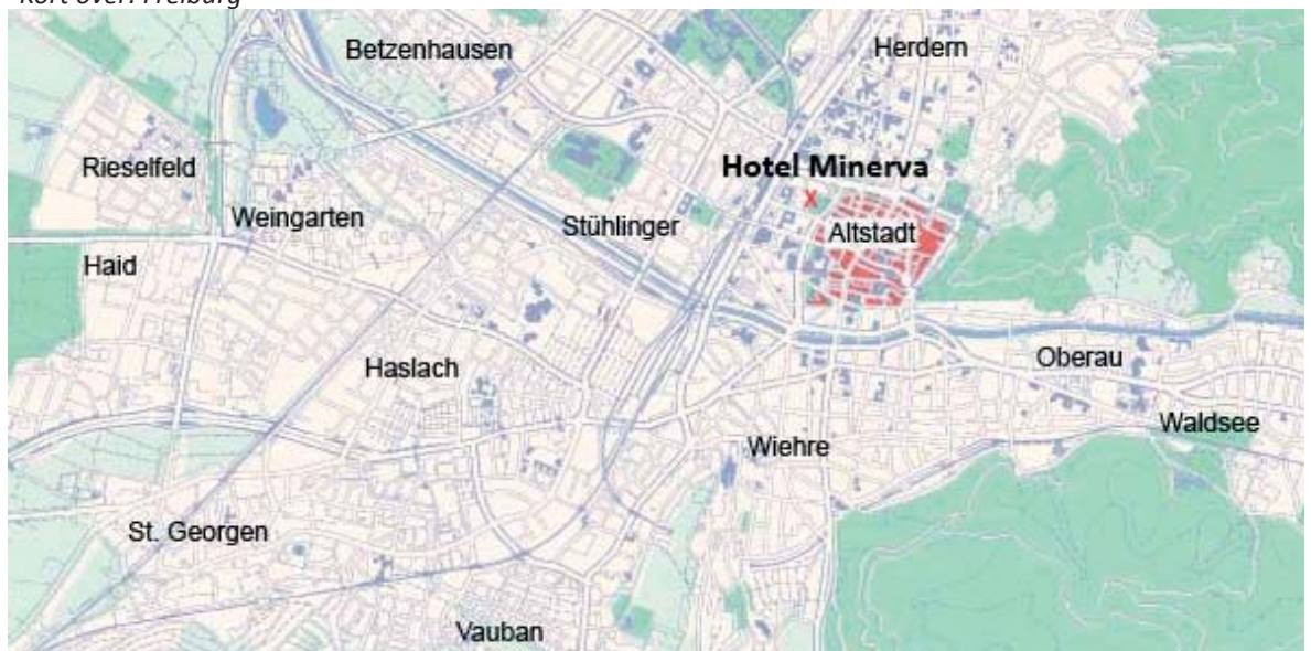
Kort over: Freiburg