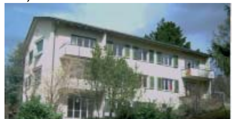
Segantinistrasse - før